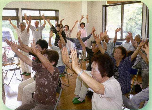
準備体操で体をほくして