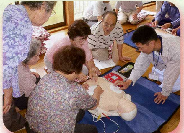
もしもの時に備え救命講習