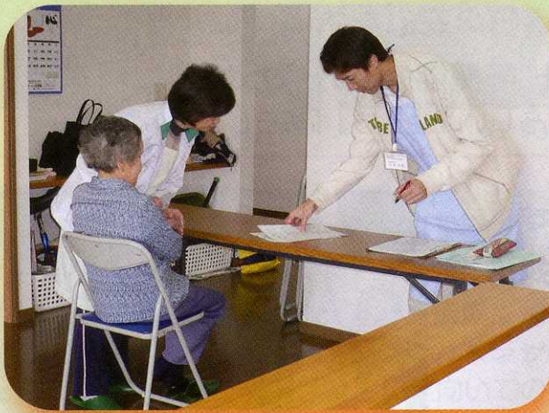
バイタルチェックで体調確認

編集発行 社会福祉法人 匝瑳市社会福祉協議会 匝瑳市八日市場ハ793番地35 (市民ふれあいセンター内) TEL 0479-73-0759