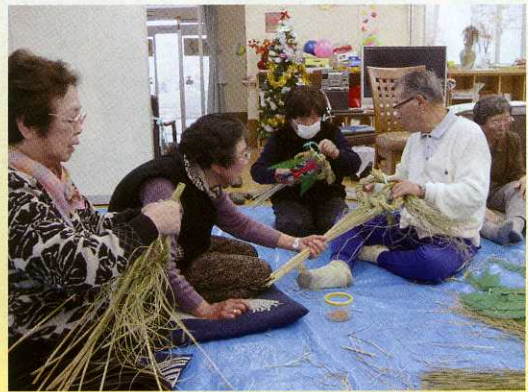
正月の準備 シメナワ作り