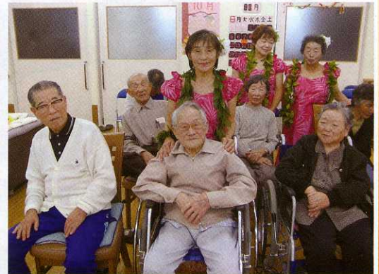
フラダンスメンバーと一緒に

～小規模多機能型居宅介護では「運営推進会議」を通じて「暮らしやすい地域」をともに考えていきます～