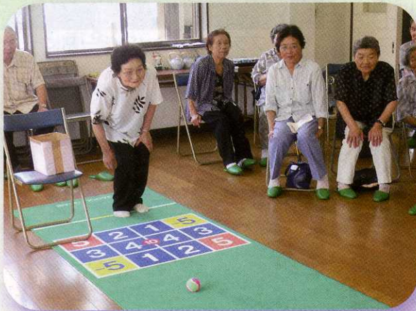
楽しいボールゲーム