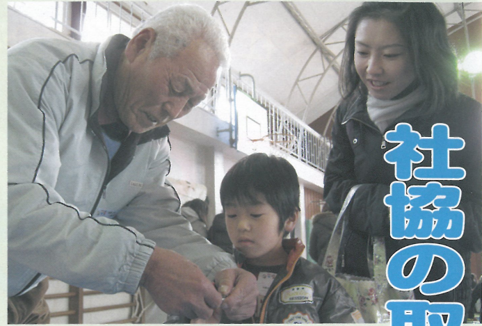
▲共興地区社協で子供に昔の遊びを教えています