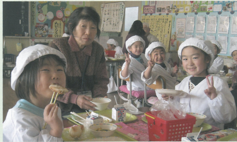
▲須賀地区社協での小学生と高齢者のふれあい給食