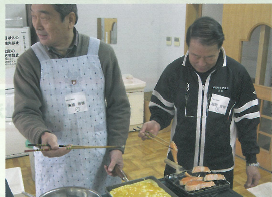
▲団塊世代の家事メン講座(調理実習の様子)