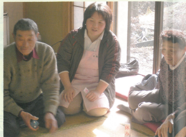
▲社協職員と地域住民と一緒にレクを楽しんでいます(社協DEサロン)

匝瑳市社協はいつでも皆さんの「きつかけ」を応援します。 地域での繋がりに希薄さを感じている方・是非とも匝瑳市社協にご相談頂きたい方・是非とも匝瑳市社協にご相談頂きたい方・是非とも匝瑳市社協にご相談頂きたい方