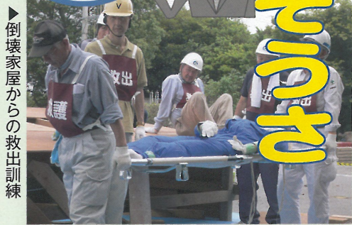
▶倒壊家屋からの救出訓練