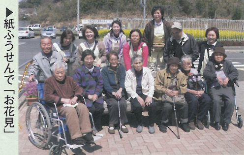
▶紙ふうせんで「お花見」

これらの活動を行なうに当たり地区社協では役員、民生児童委員、その他団体、地域の方々で話し合いがされており、自分たちの地域は自分たちで守っていく安心安全な町づくりに取り組みまれています。