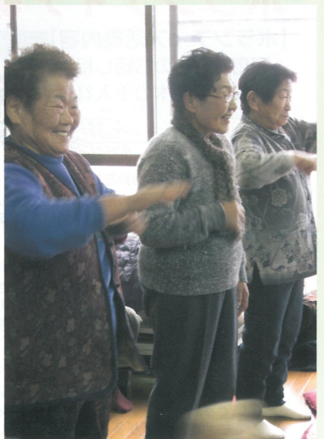
▲社協DEサロンでお手伝い(健康体操の様子)