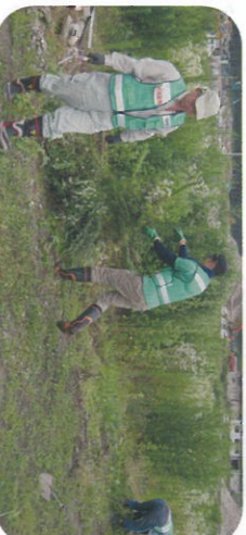
【被災地支援に行かれる方へ】 被災地支援に行かれる方は事前に市社協にてボランティア活動保険（天災夕イフ）にご加入をお願いします。

何か自分にも出来そうな事が見つかりましたか？ もし、見つからなくても大丈夫！！社協はあなたを バックアップします。電話でも来所されても OK！まずはご相談してください。 あなたの力を待っている方がいます。