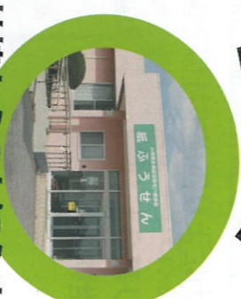
社協からのお知らせ