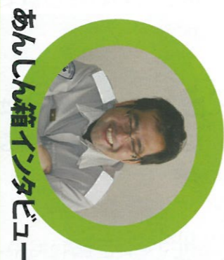
あんしん箱インタビュー